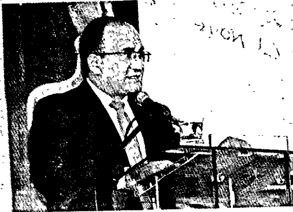
▲ Guillermo Herrera, prefecto del Carchi, presenta su Informe de gestión 2017 en los cantones carchenses.