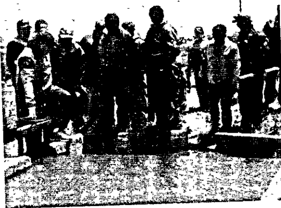
El 85% de mano de obra sería carchense y el 15% de otros lugares